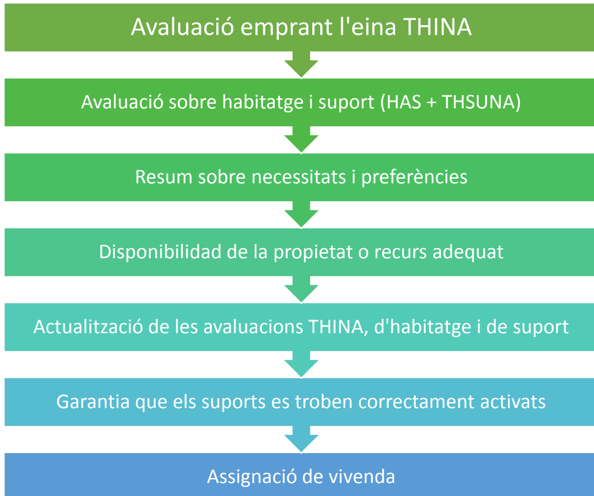
Figura1. Procés integral d'avaluació de Drets, necessitats d'habitatge i suport TopHouse

La següent figura il·lustra visualment el procés de d'avaluació integral TopHouse emprant les eines desenvolupades a través del projecte (THINA,HAS i THSUNA):